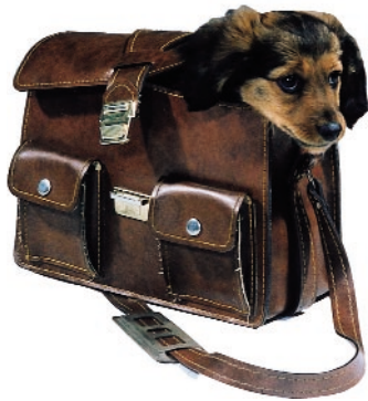
Auch für den kleinsten Hund muss man Steuern zahlen

Bruttoeinkommen minus Abgaben = Nettoeinkommen